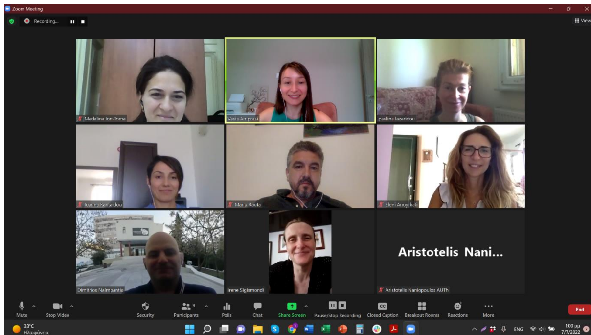
Εικόνα 2 Συμμετέχοντες του προπαρασκευαστικού εργαστηρίου INNOTRANS

Για να παραμείνετε ενημερωμένοι σχετικά με την καινοτομία στις μεταφορές στην εποχή του COVID-19, μείνετε συντονισμένοι και εγγραφείτε τώρα στην τελική εκδήλωση του έργου INNOTRANS του Προγράμματος Interreg Europe: https://forms.gle/HdmgX2iFG4eZ2Re3A .